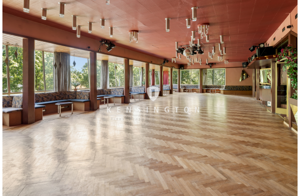
Raum 2 im Abrissgebäude