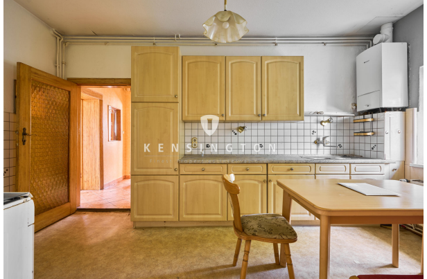
Wohnküche im Erdgeschoss