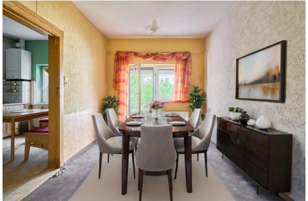
Esszimmer zur Terrasse 2