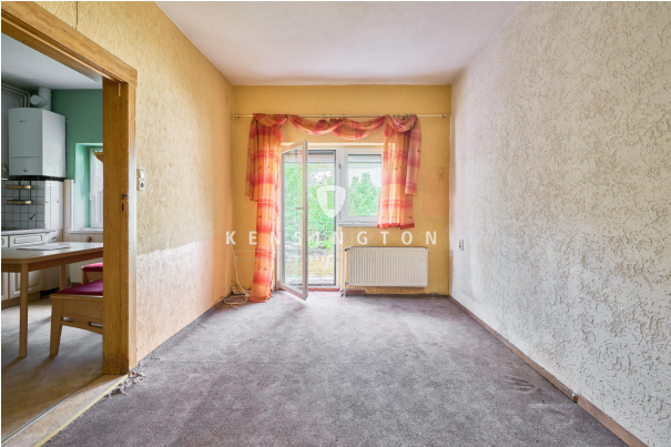
Zimmer im Erdgeschoss