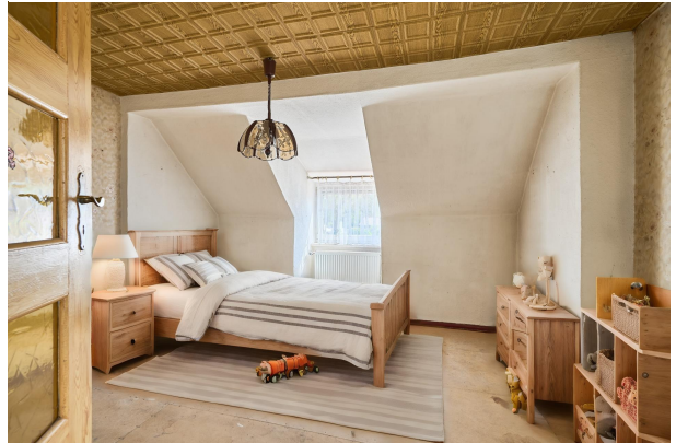
Wohnbeispiel Kinderzimmer 1 im Obergeschoss