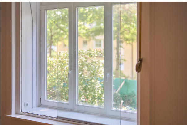
Sanierte Kastenfenster im Wohnzimmer