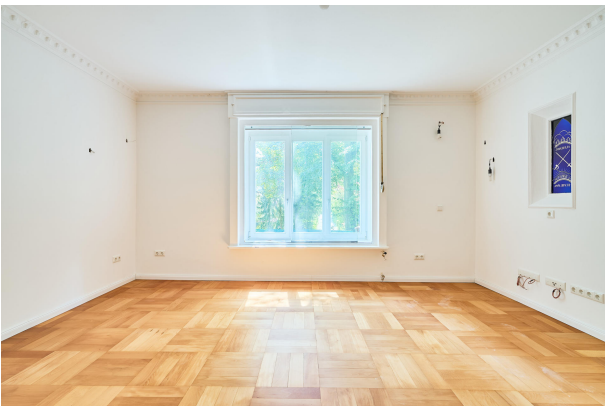
Wohn- oder Esszimmer