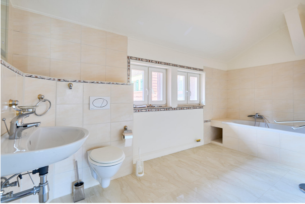
Geräumiges Badezimmer im Obergeschoss