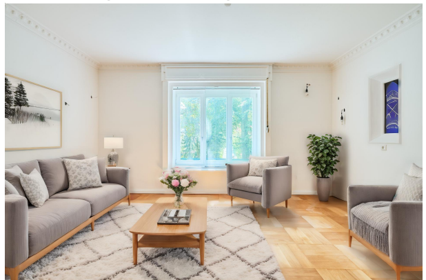
Visualisierung und Einrichtungsidee zum Wohnzimmer