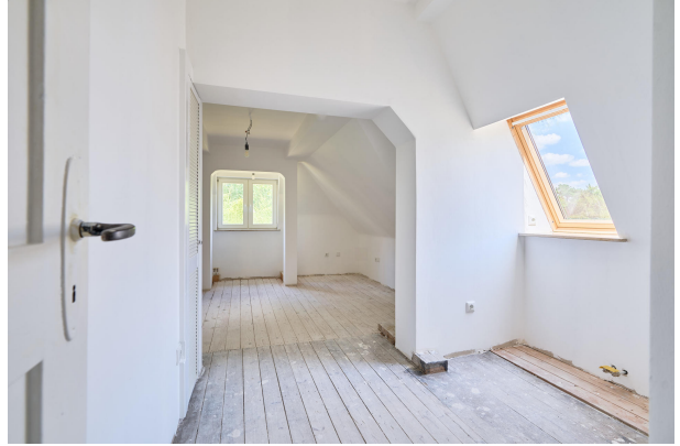
Gemütliches 2. Schlafzimmer im Obergeschoss