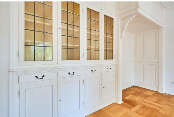
Hochwertige Tischlerarbeiten im Wohnbereich