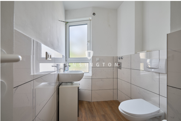
Beispielfoto - Holzboden