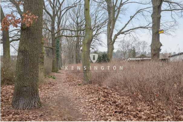
Gartenanlage vor der Siedlung