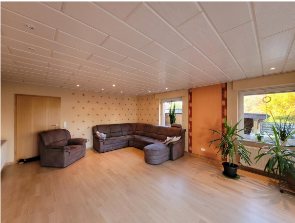
Wohnen Haus 2