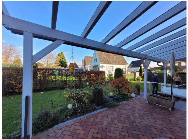
Veranda Haus 2