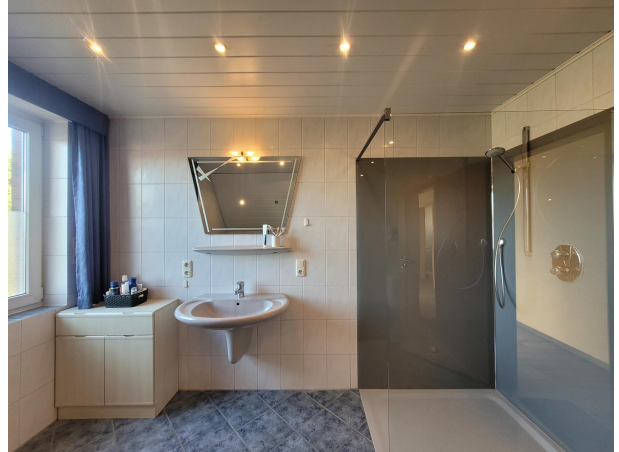
Bad Haus 2