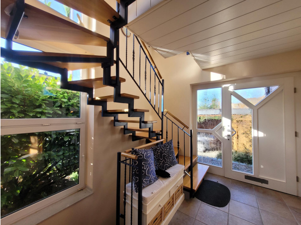
Flur Haus 2