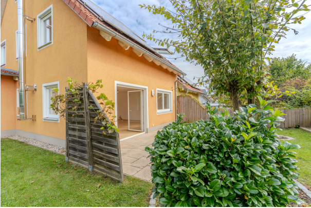
Ihre sonnige DHH!