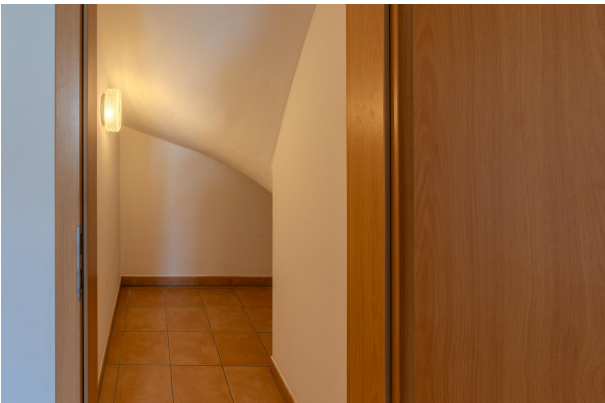
Praktischer Stauraum unter der Treppe!