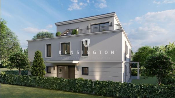
Außenansicht mit Blick auf den Eingangsbereich