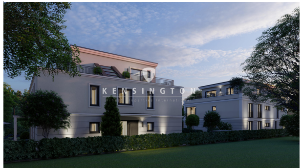
Außenansicht am Abend