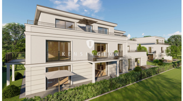
Außenansicht mit Garten