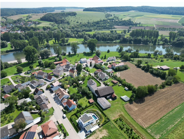
Die letzten Sonnenstrahlen!