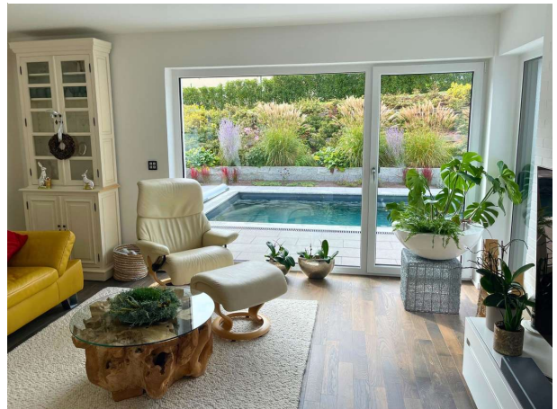
Gemütlich mit Terrassenausgang!