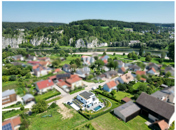
Traumhaft ruhige Lage in Stausacker!