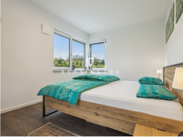
Elternschlafzimmer - außergewöhnlich ruhig!