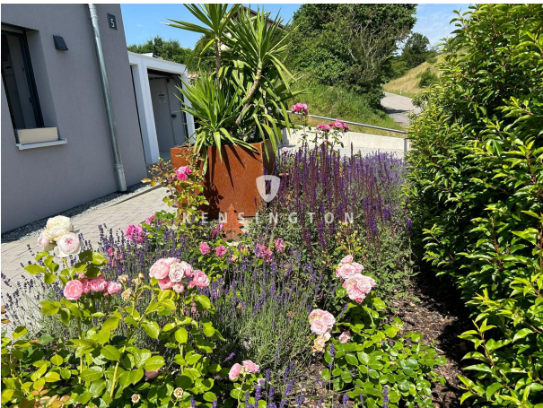
Toller Garten, neu angelegt!