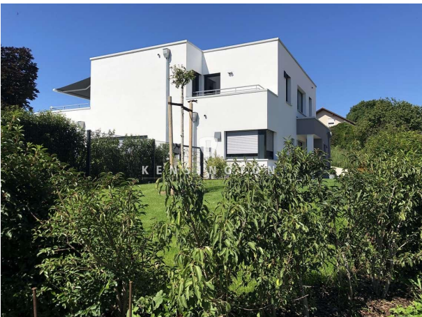
Ein herrlich ruhiger Ort zum Wohnen!