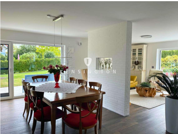
Gemütlich mit Terrassenausgang!