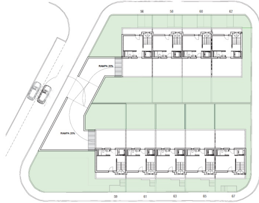
PLANTA SEGONA ↻