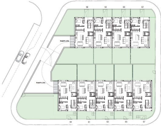
PLANTA BAIXA ↻