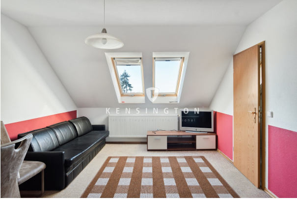
Wohnzimmer in einer der Wohnungen