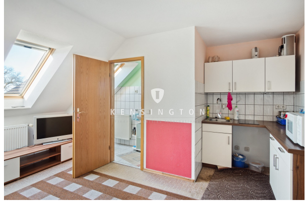
Küche mit Blick ins Bad (Wohnung)