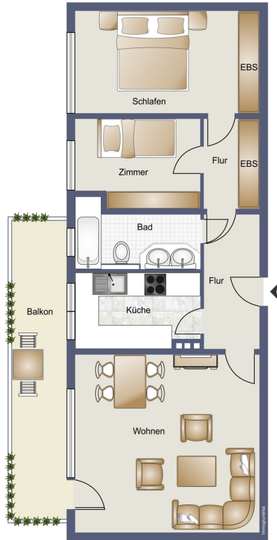
Flur mit Einbauschränken