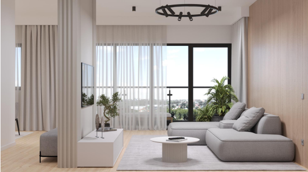
Beispiel Wohnzimmer, WE 03