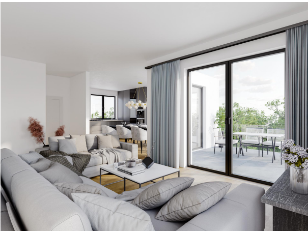
Beispiel Wohnzimmer, WE 05