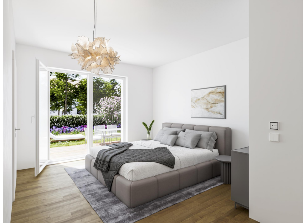
Beispiel Schlafzimmer, WE 02