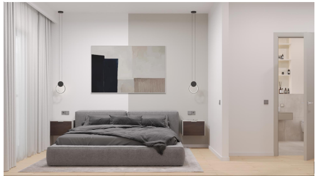
Beispiel Schlafzimmer, WE 03