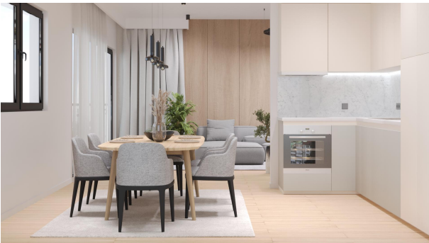
Beispiel Essbereich, WE 03