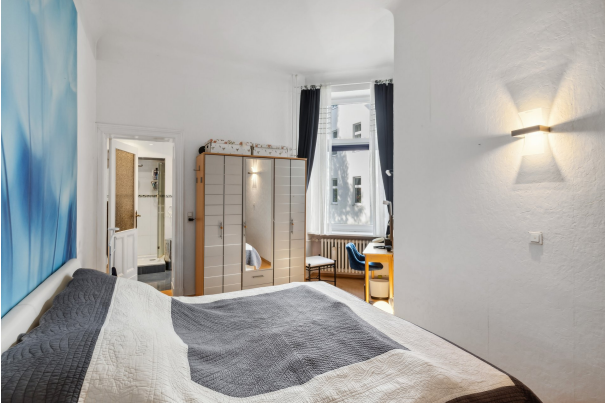
Schlafzimmer zum Innenhof