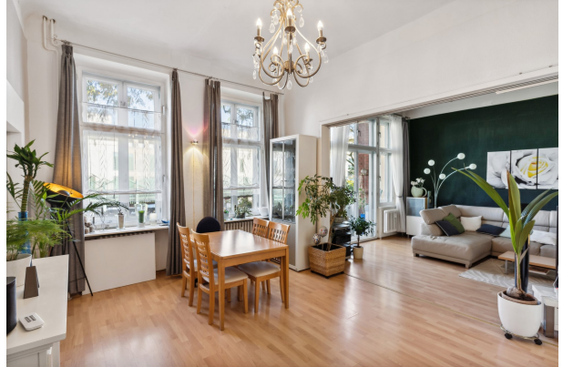
Esszimmer, daneben das Wohnzimmer