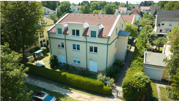
Außenaufnahme Hauseingang straßenseitig