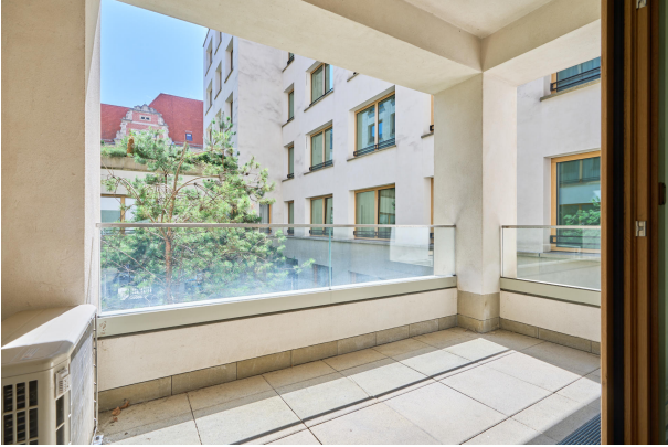
Loggia mit Südausrichtung