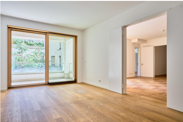
Bodentiefe Schiebetüren zur Loggia