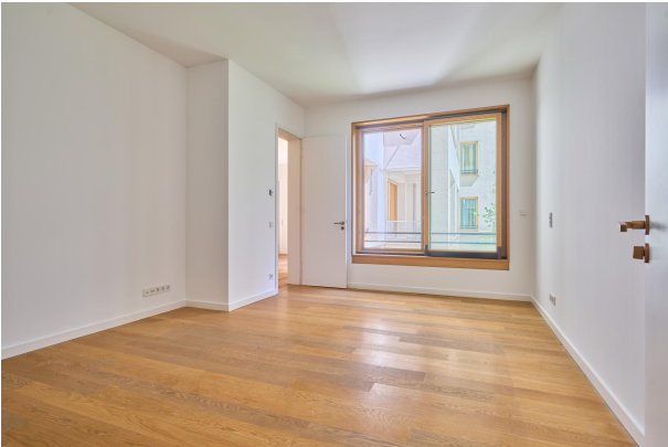
Schlafbereich mit Bad en suite