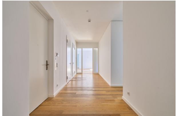
Großer Flur mit HWR und Abstellkammer