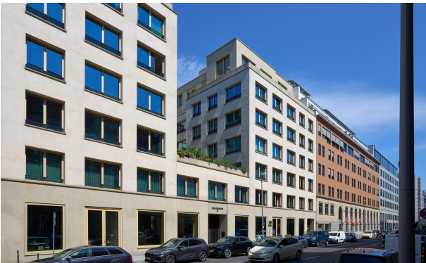
Gesamtes Konzept aus der Hand von Sir David Chipperfield