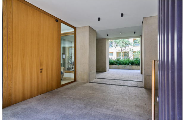
Eingangsbereich mit Concierge