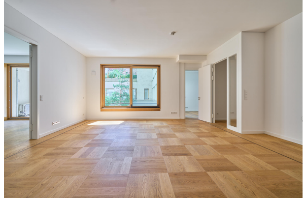
Wohnzimmer mit 3m Deckenhöhe