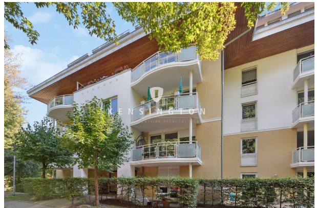
Haus von vorne