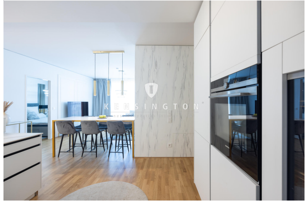
Küche - Blick zum Essbereich