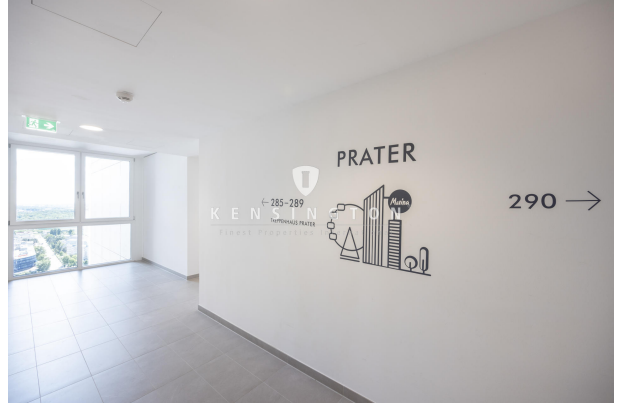
Flur 26. Etage