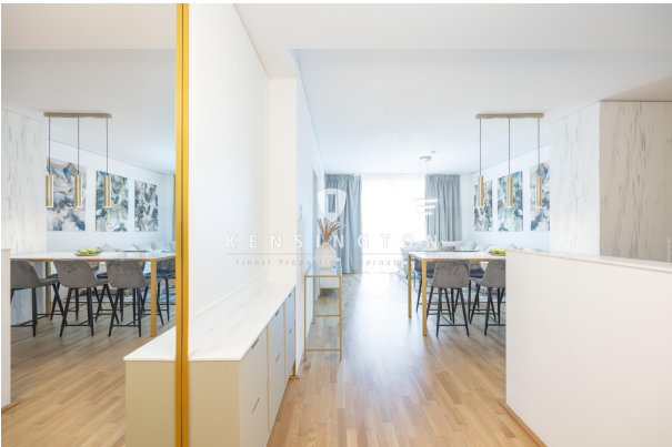
Flur - Eingangsbereich