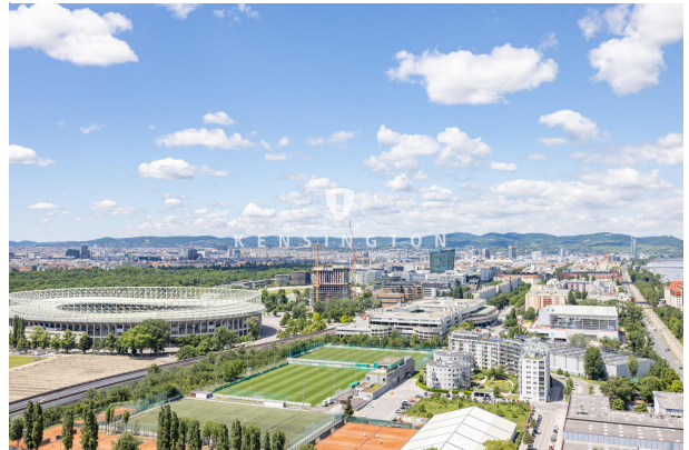
Grandioser Ausblick - Ernst-Happel-Stadion und Prater