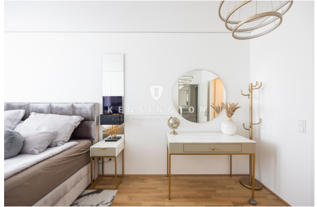
Schlafzimmer - Schminktisch