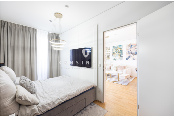
Gästezimmer mit TV