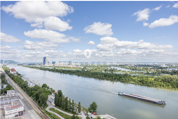
Grandioser Ausblick - Donau