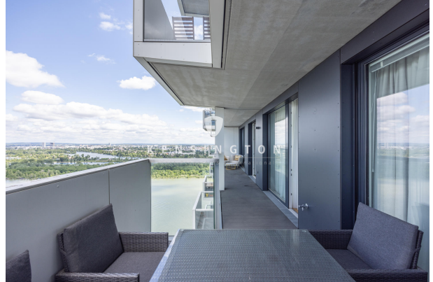
Loggia mit Balkon