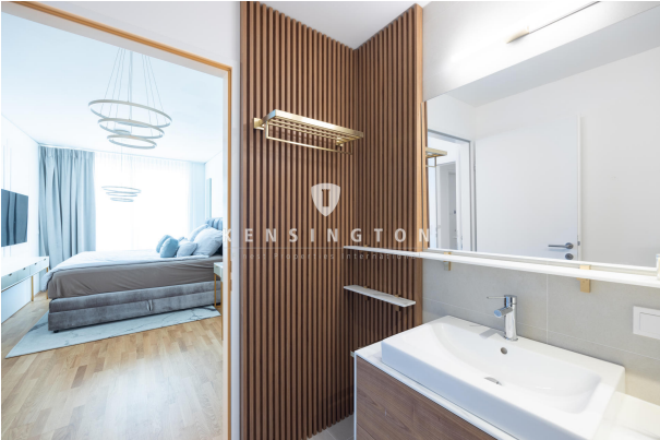
Blick zum Schlafzimmer